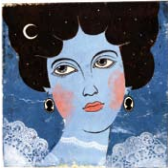
Affiche de la pièce Ring Round the Moon

La Compagnie de théâtre Soulpepper, qui a célébré son 10 e anniversaire en 2008, présente des chefs-d'oeuvre classiques du monde dans une perspective canadienne. Cette troupe réputée offre également de la formation à la prochaine génération de comédiens et transmet son amour des arts par l'intermédiaire de son